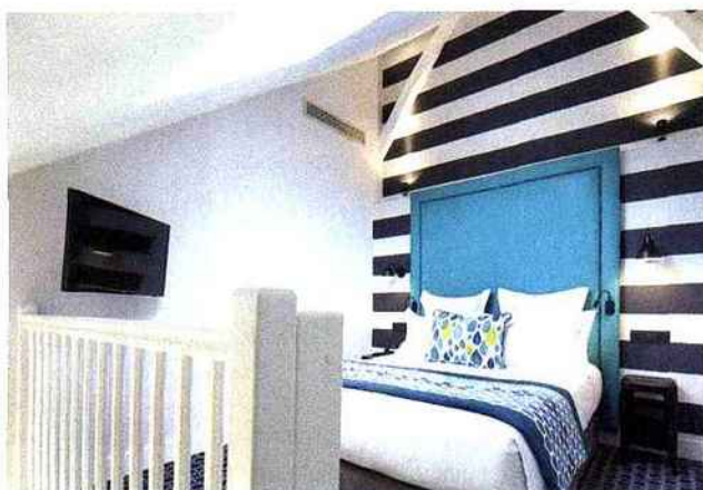
Chambre de type loft.