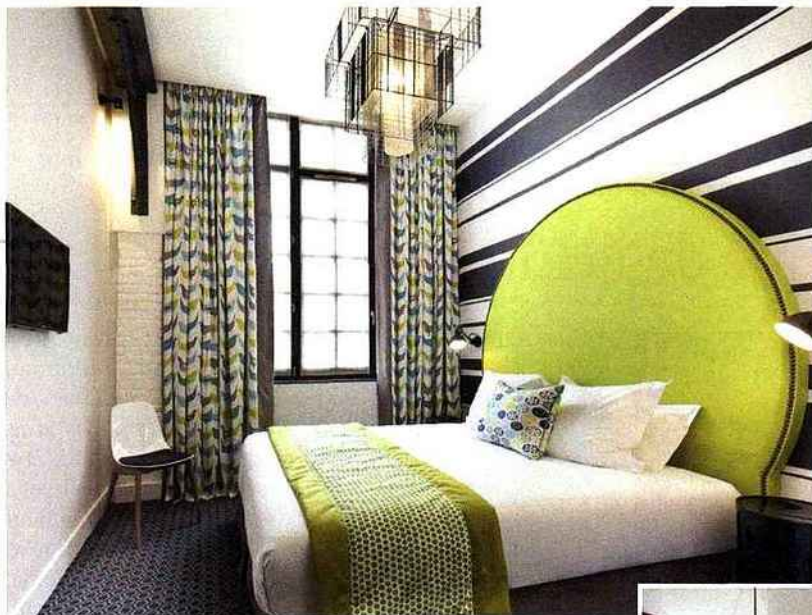
Chambre vert prairie et poutre métallique.