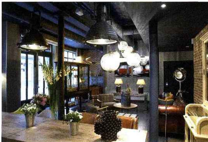
Le lobby esprit loft new-yorkais.