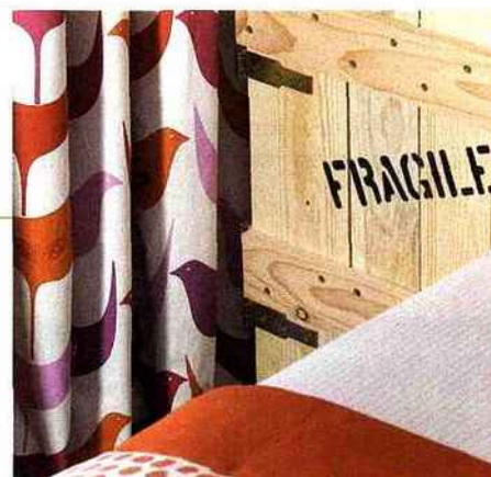
Détail d'une chambre.