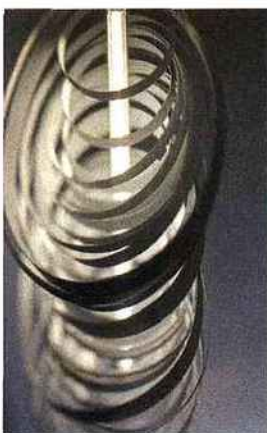
Luminaire effet découpe de métal.